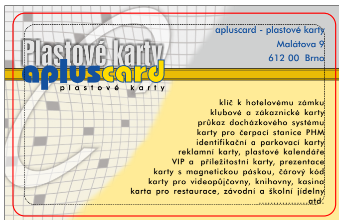
Výsledný produkt - plastová karta, rozměr ISO 85,6 x 54 mm

Žádný objekt s výjimkou pozadí by neměl být blíže než 3 mm od okraje čistého rozměru karty (85,6 x 54 mm). Vzhledem k toleranci tisku může dojít k drobnému posunu grafiky vůči hraně karty, což při menší vzdálenosti objektů od hrany působí rušivě. Pozadí (včetně grafických objektů) tištěné „na spad“ musí dosahovat až k okraji hrubého rozměru (90 x 58 mm). Pokud některý objekt přesahuje hrubý rozměr, musí být oříznut.